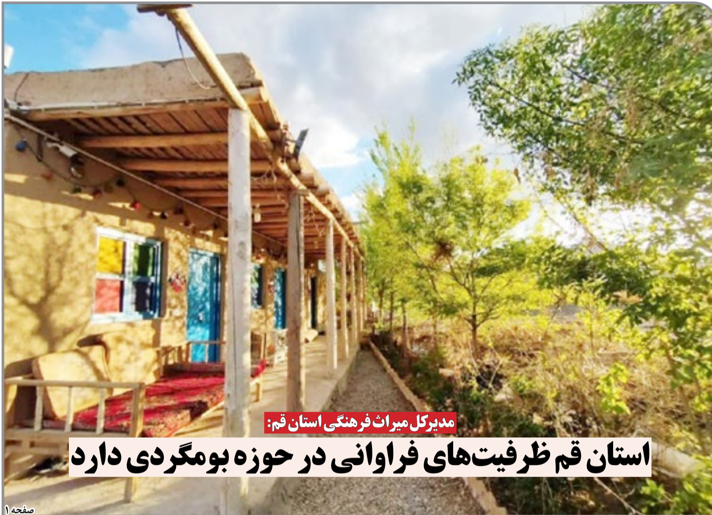
مدیرکل میراث فرهنگی استان قم: