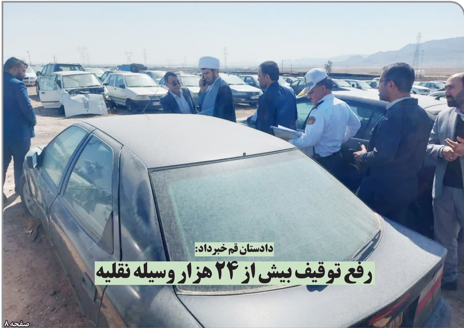
دادستان قم خبر داد: